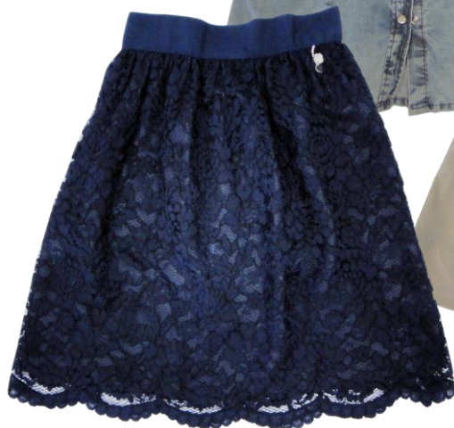
Denny Rose ¥22,000+TAX