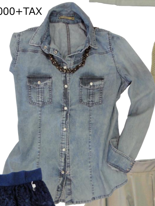
Patrizia Pepe ¥32,000+TAX