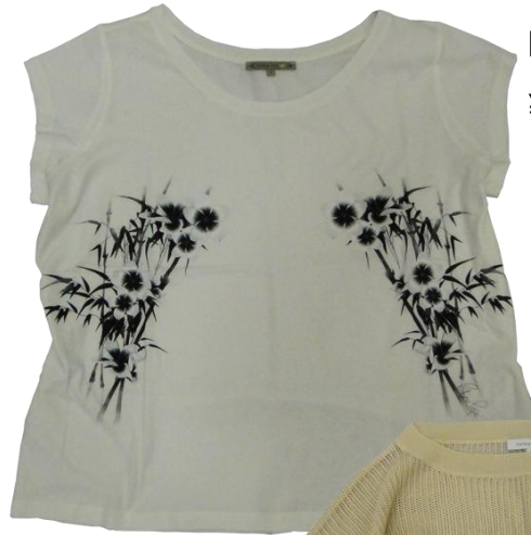
Patrizia Pepe ¥13,000+TAX