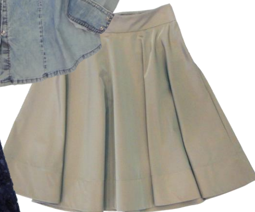
Patrizia Pepe ¥35,000+TAX