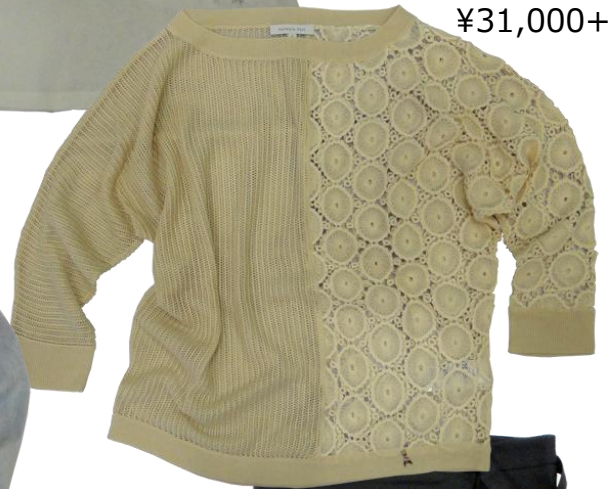
Patrizia Pepe ¥31,000+TAX