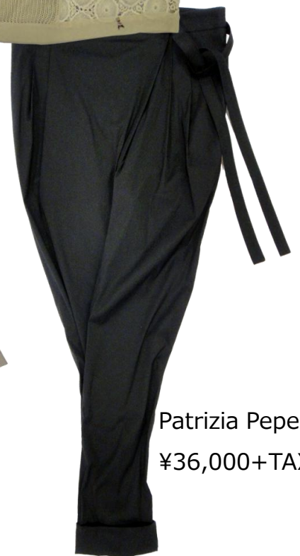
Patrizia Pepe ¥36,000+TAX