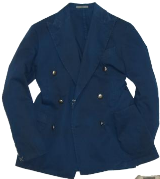
BOGLIOLI Coat Line-Jacket

ひざ丈ショーツに抵抗を感じる方々もいらっしゃるでしょうが、ぜひ今季はお試しを。 清涼感と軽快感、こなれ感が一気に手に入ります。 ジャケット×ショーパンのスタイリングこそ、小僧たちには真似できない大人スタイルです。