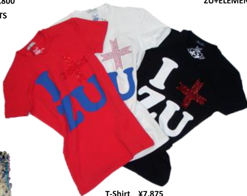
T-Shirt ¥7,875 ZU+ELEMENTS