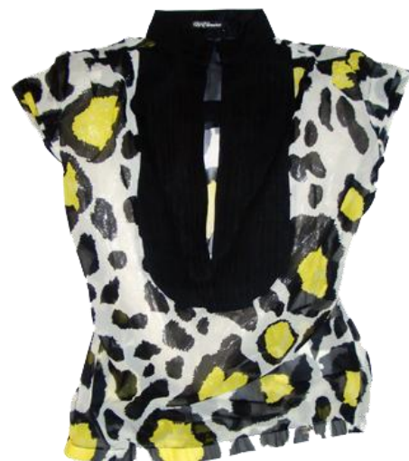
Tops ¥17,850 ZU+ELEMENTS