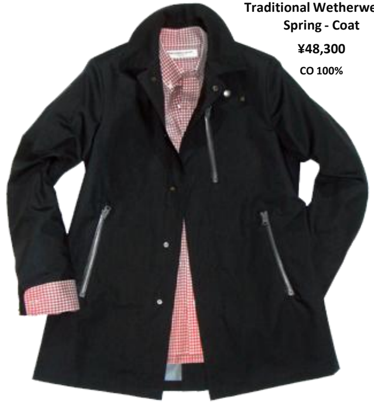
Traditional Wetherwear Spring - Coat