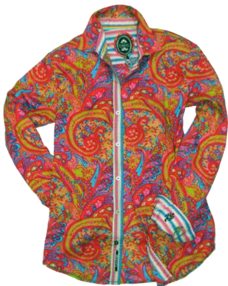
Print-Shirts ¥13,440 GANESH

腕にはアクセが欠かせない時代となりました。 無造作に巻いた手元のニュアンスづけは、どんなスタイルにも大ススメです。 夏ならば、やはりターコイズで決まりですかね。