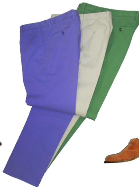
Cotton-Pants ¥28,400 CO 97% EL 3%