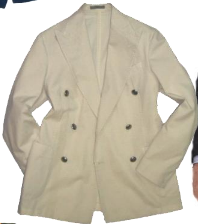
BOGLIOLI Coat Line-Jacket