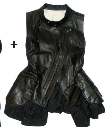
Leather-Vest ¥59,850 LAM.CI