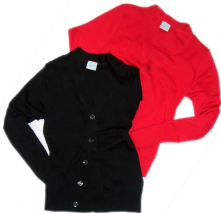
Knit-Cardigan ¥21,000 CO100%