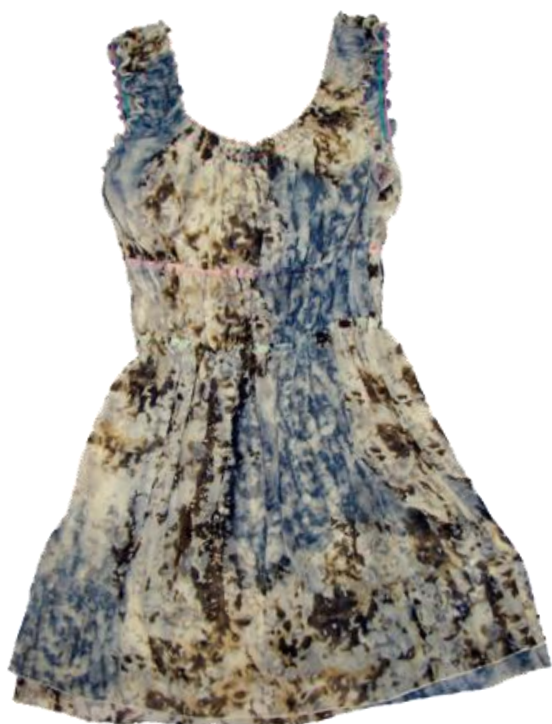
One Piece ¥49,350 ZU+ELEMENTS