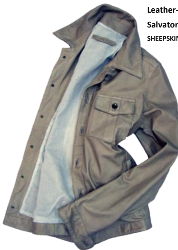
Leather-Shirts ¥101,850 Salvatore Santoro SHEEPSKIN 100%