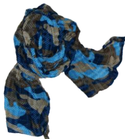
Cotton-Stole ¥8,400 Stefano Conti

季節を問わず使えるSTOLEは、いまや完全にファッションアイテムと化しました。ヒョイッと巻けば、それだけでお洒落になれるというのだから取り入れない手はありません。そのキモをマスターすれば、お洒落の幅がぐっと広がります。