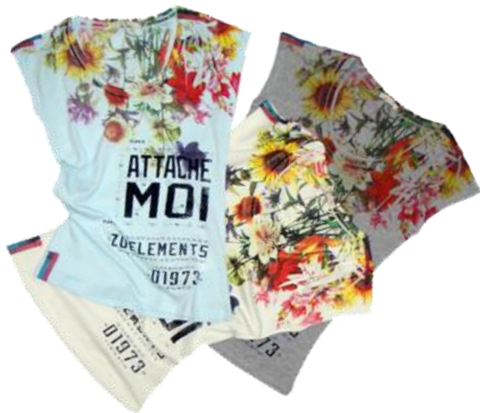
Cutsewn ¥16,800 ZU+ELEMENTS

最近イタリア各地のショップで扱われ脚光を浴びているカジュアル・ブランドZU+ELEMENTS。細部のディテールやPOPで斬新なデザインは、まさに最旬ブランド。