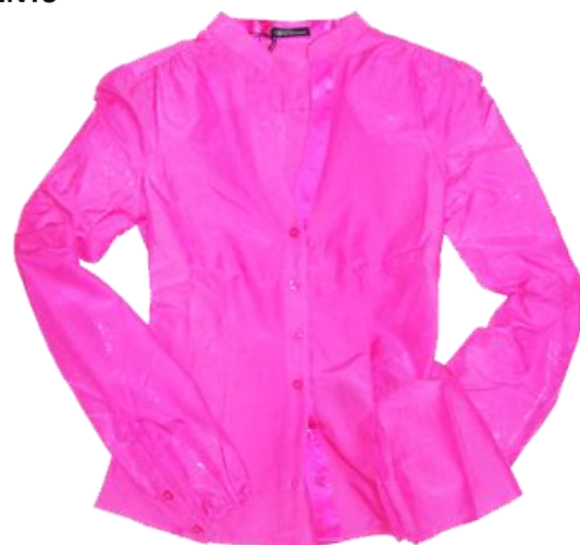
Blouse ¥21,000 ZU+ELEMENTS