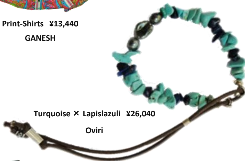
Turquoise × Lapislazuli ¥26,040 Oviri