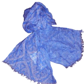
Cotton-Stole ¥14,700 AD 56 MILANO