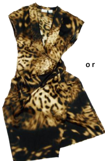
One Piece ¥39,900 COMPAGNIA ITALIANA