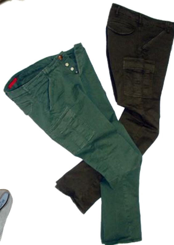
Chino-Cargo ¥24,150 Red Card CO 97% PW 3%