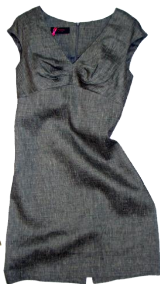
One Piece ¥45,150 LALTRA MODA