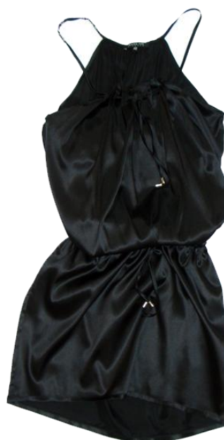
One Piece ¥37,800 PATRIZIA PEPE