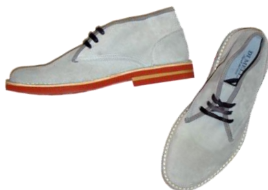
Suede-Shoes ¥39,900 Di Mella