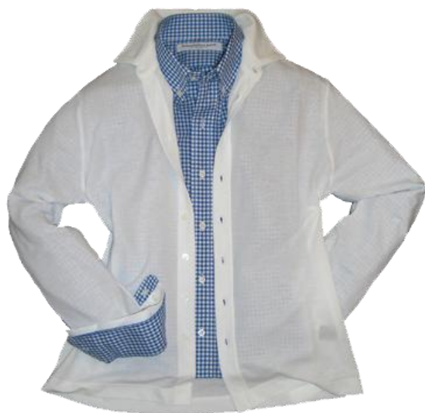
Ice-Cotton Cut Sewn ¥31,500 ZANONE