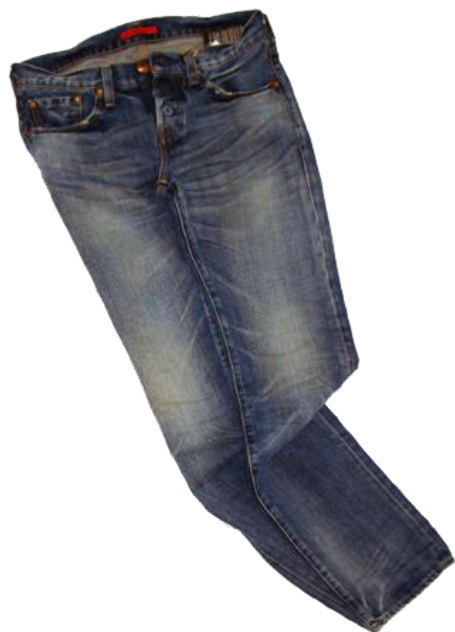
Denim ¥19,950 Red Card CO 100%