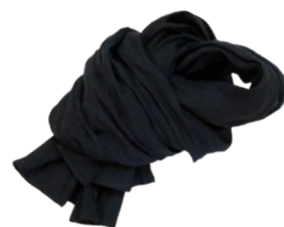
Linen-Stole ¥9,450 Stefano Conti